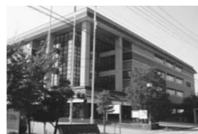
高山市民文化会館